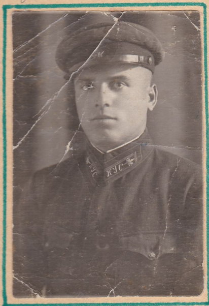
Киевское училище связи

Здесь он впервые переступил пороги местной школы, зародившей в нем искорку любви к учительской профессии. Учился очень хорошо, любил музыку, играл на пианино, увлекался спортом, был дружен с товарищами, охотно помогал родителям по дому, увлекался радиотехникой. С детства мечтал стать учителем. И вот в 1940 году началась его