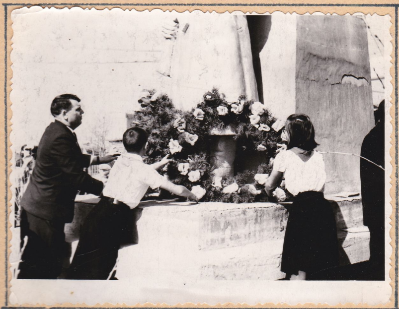
Геддор Иванович возлагает с учащимися венки.