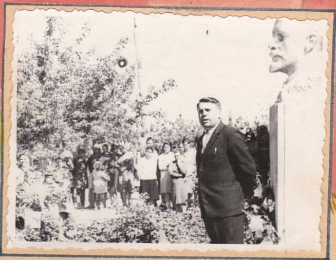
Федор Иванович выступает на митинге.