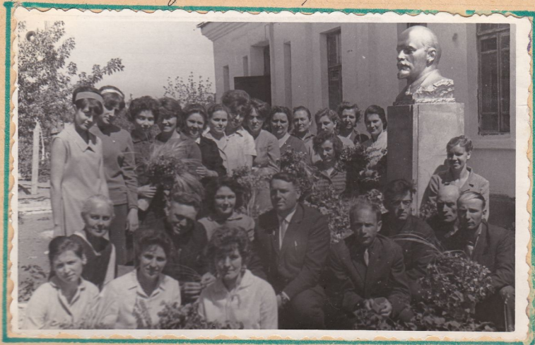
Ледколлектив Мадунской средней школы

Затем переезжает по просьбе парткома в село Мадунки, где его назначают дирек- тором Мадунской средней школы.